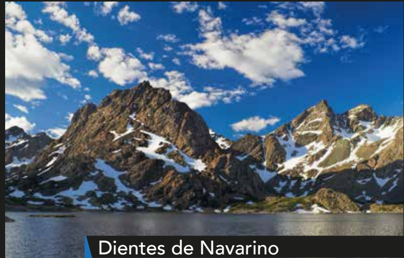
Dientes de Navarino