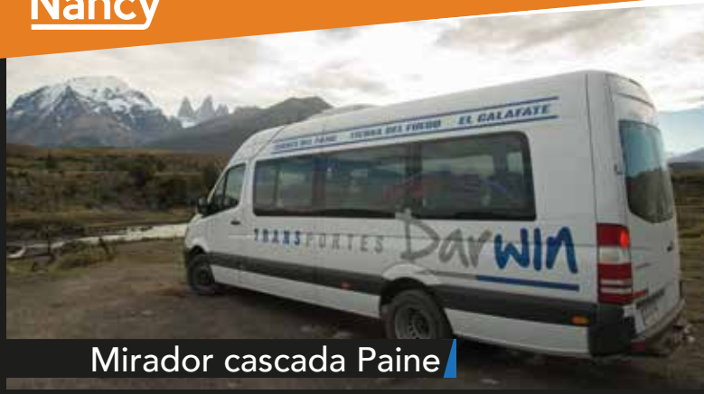
Mirador cascada Paine