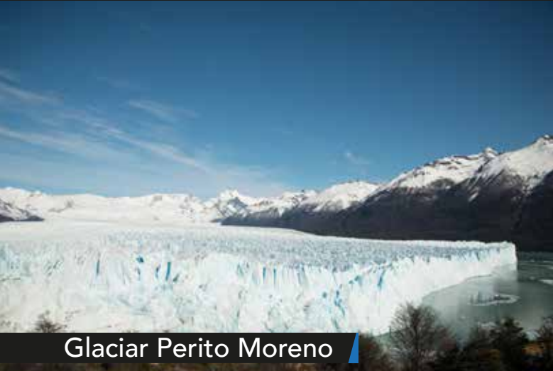
Glaciar Perito Moreno