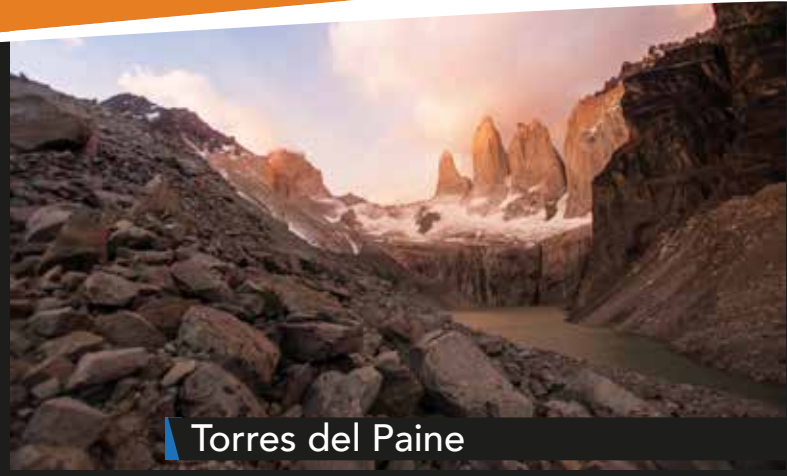
Torres del Paine