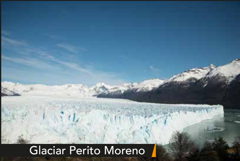
Glaciar Perito Moreno