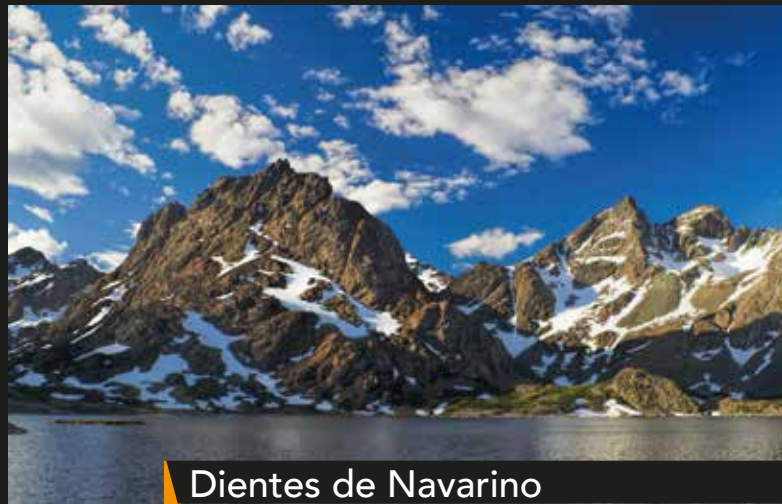
Dientes de Navarino