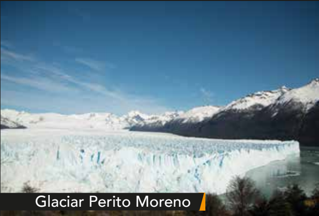
Glaciar Perito Moreno