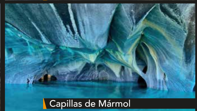
Capillas de Mármol