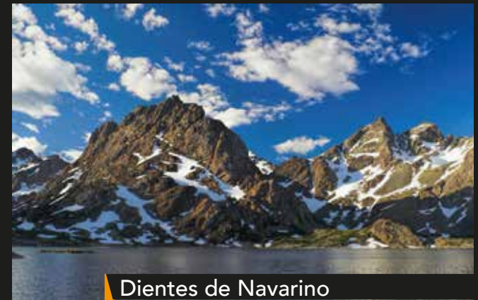
Dientes de Navarino