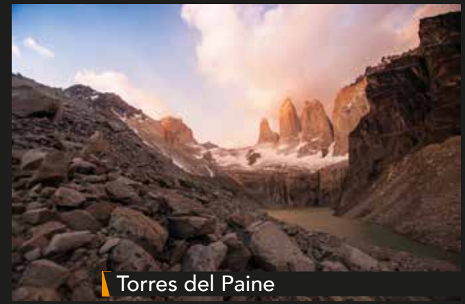
Torres del Paine