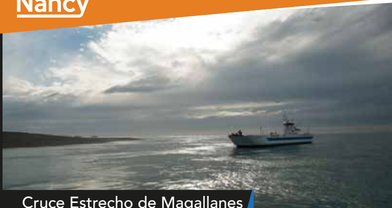
Cruce Estrecho de Magallanes