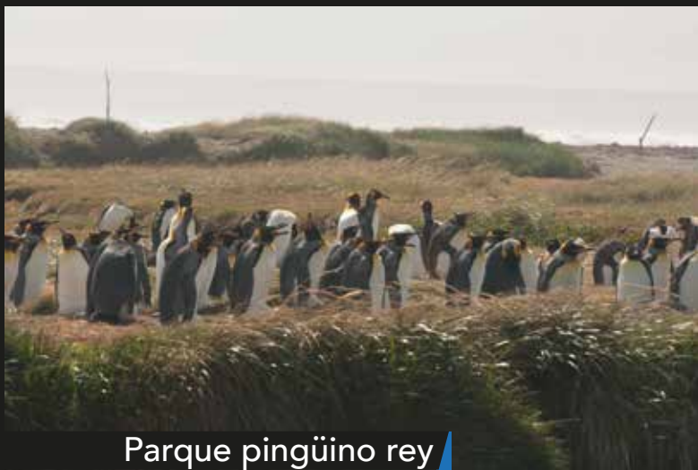
Parque pingüino rey