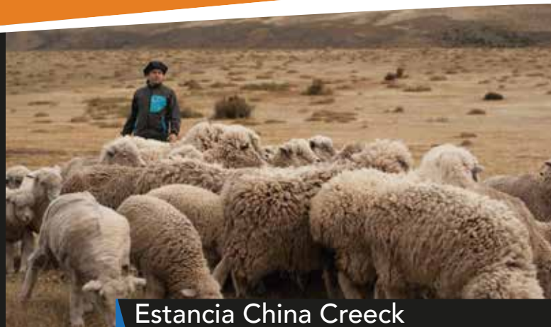
Estancia China Creek