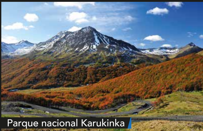
Parque nacional Karukinka