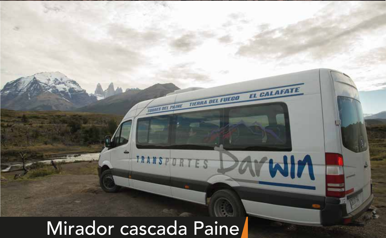
Mirador cascada Paine