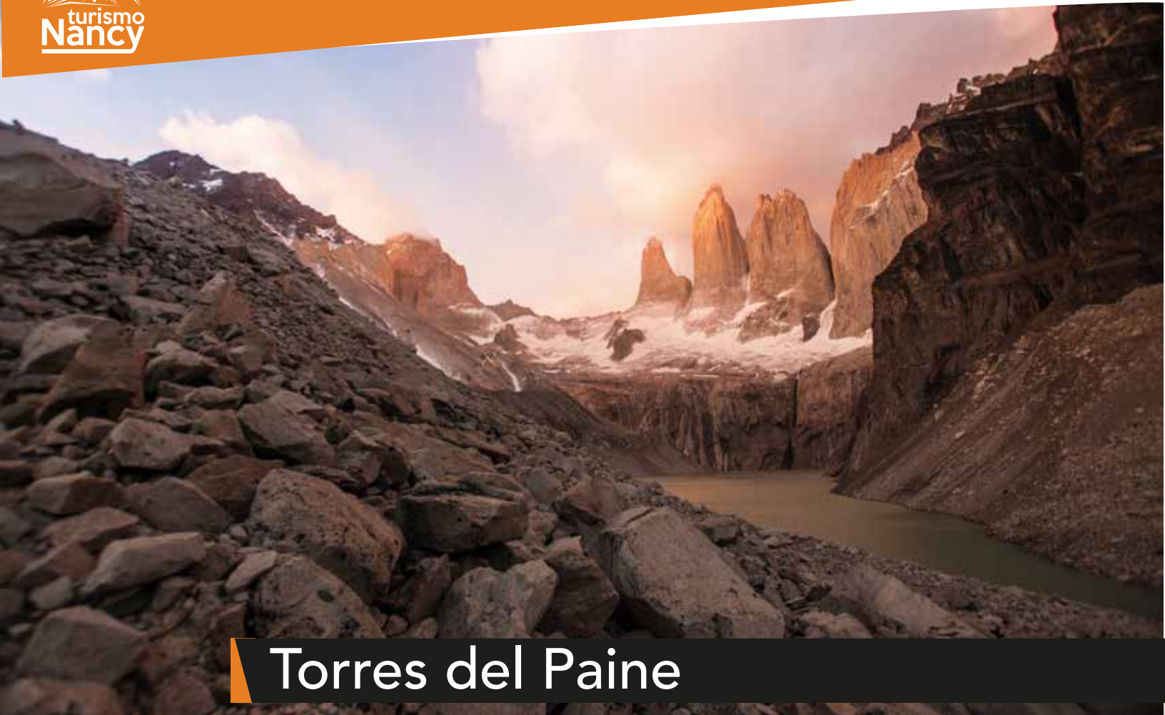
Torres del Paine